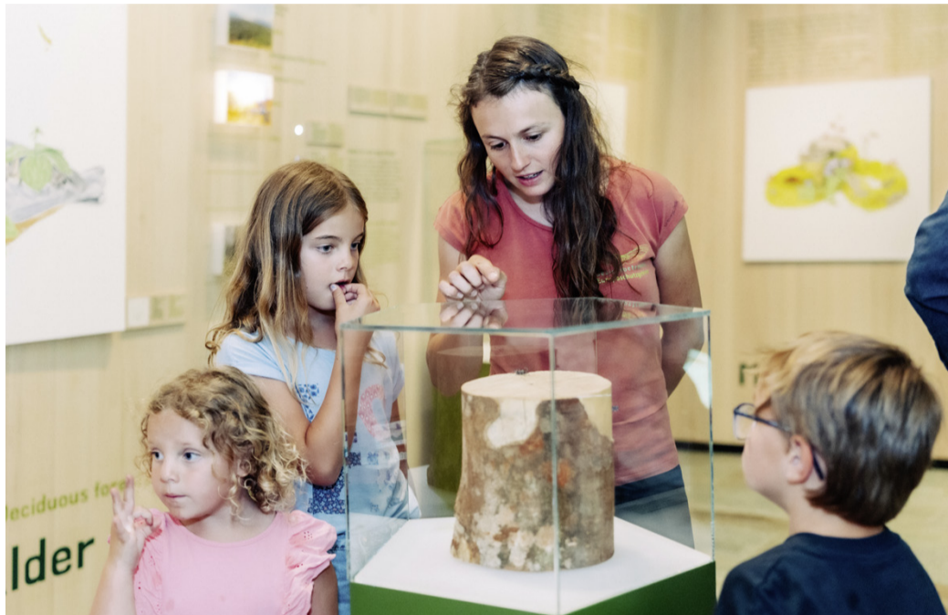
Der Naturraum.Verwall ist Anziehungspunkt für Groß und Klein.