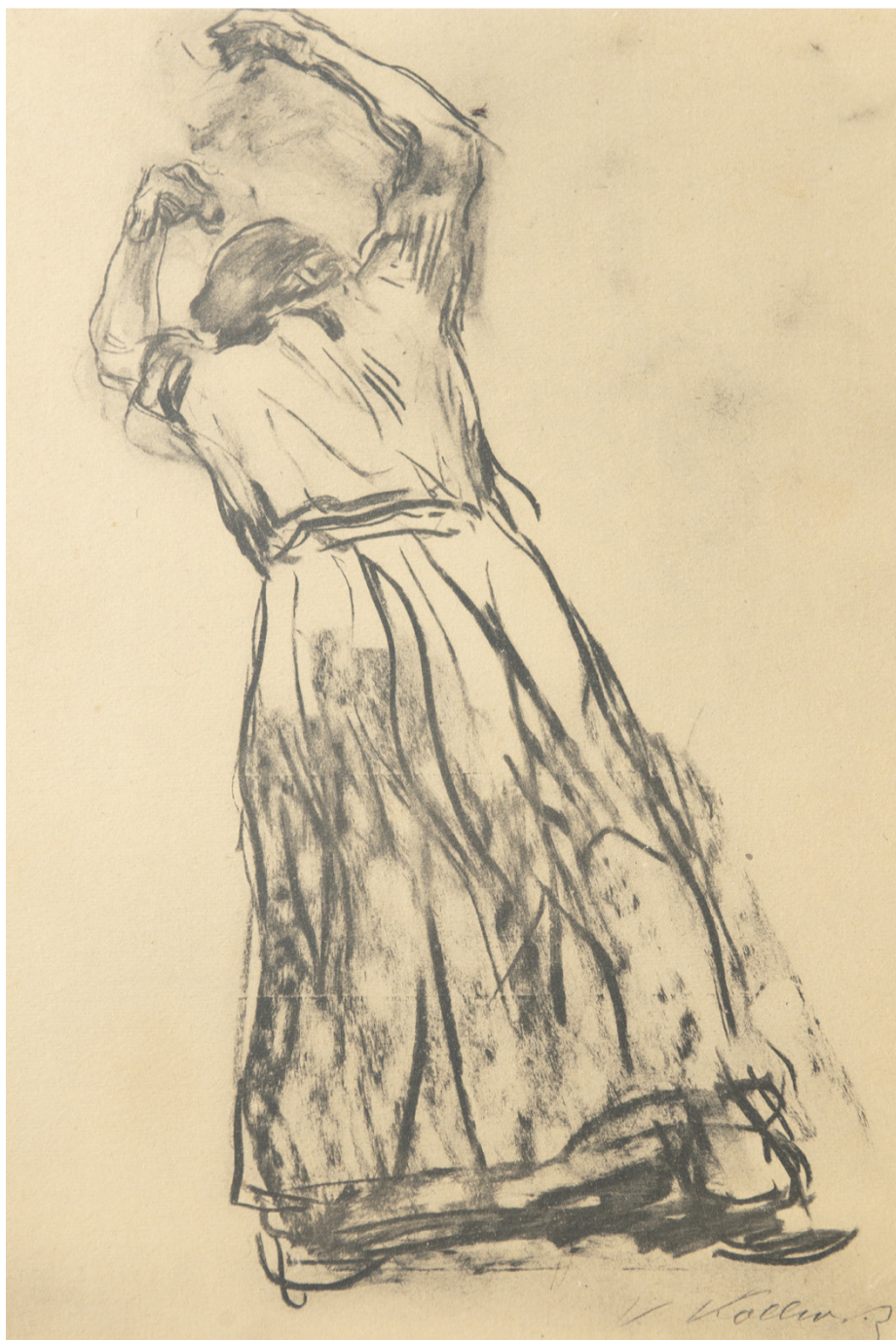
Lichtdruck von Käthe Kollwitz, Losbruch , Blatt 6 aus dem Zyklus Bauernkrieg , 1920.

Frieden tun. Über Gerechtigkeit, Demokratie, Geschlecht Frauenmuseum Hittisau Platz 501, 6952 Hittisau www.frauenmuseum.at