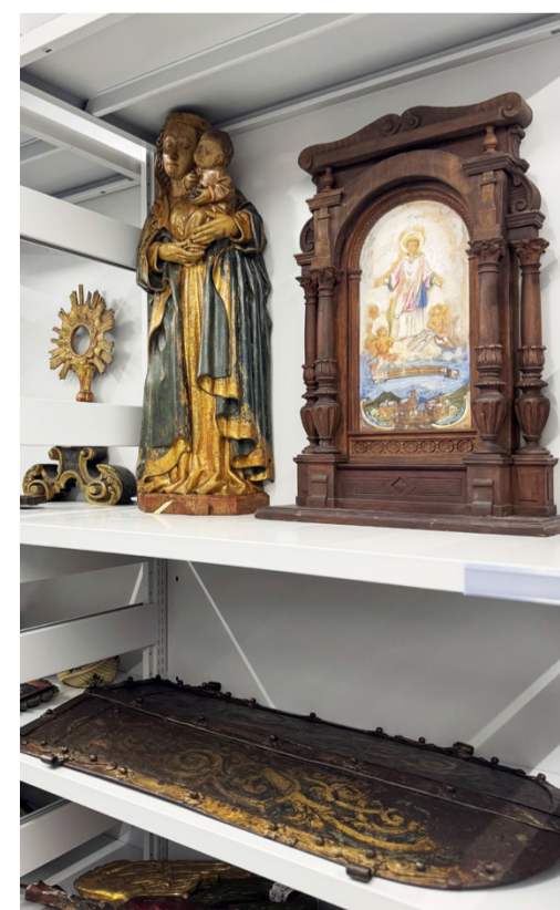
oben und rechts: Einblicke in das neue Museumsdepot.