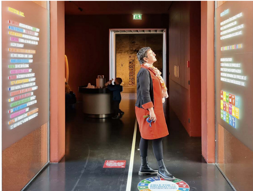
Die Sustainable Development Goals (17 Nachhaltigkeitsziele der UN) sind in der inatura in Dornbirn in die gesamte Ausstellung integriert und werden so den Besucher:innen nahegebracht.