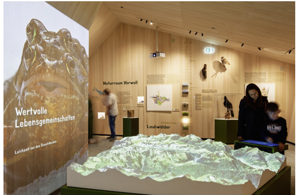
Klein, aber oho – der Naturraum.Verwall hat viel Wissenswertes zu bieten.

Das Verwall, abgeleitet vom romanischen val bel ( schönes Tal ), ist eine der prägenden Gebirgsgruppen im Montafon. Zugleich steht Verwall für das flächenmäßig größte Europaschutzgebiet Vorarlbergs. In der im Juni 2025 eröffneten Ausstellung in Partenen erhalten Besuchende spannende Einblicke in die Vielfalt der heimischen Tier- und Pflanzenwelt und die Natura-2000-Gebiete im Montafon.