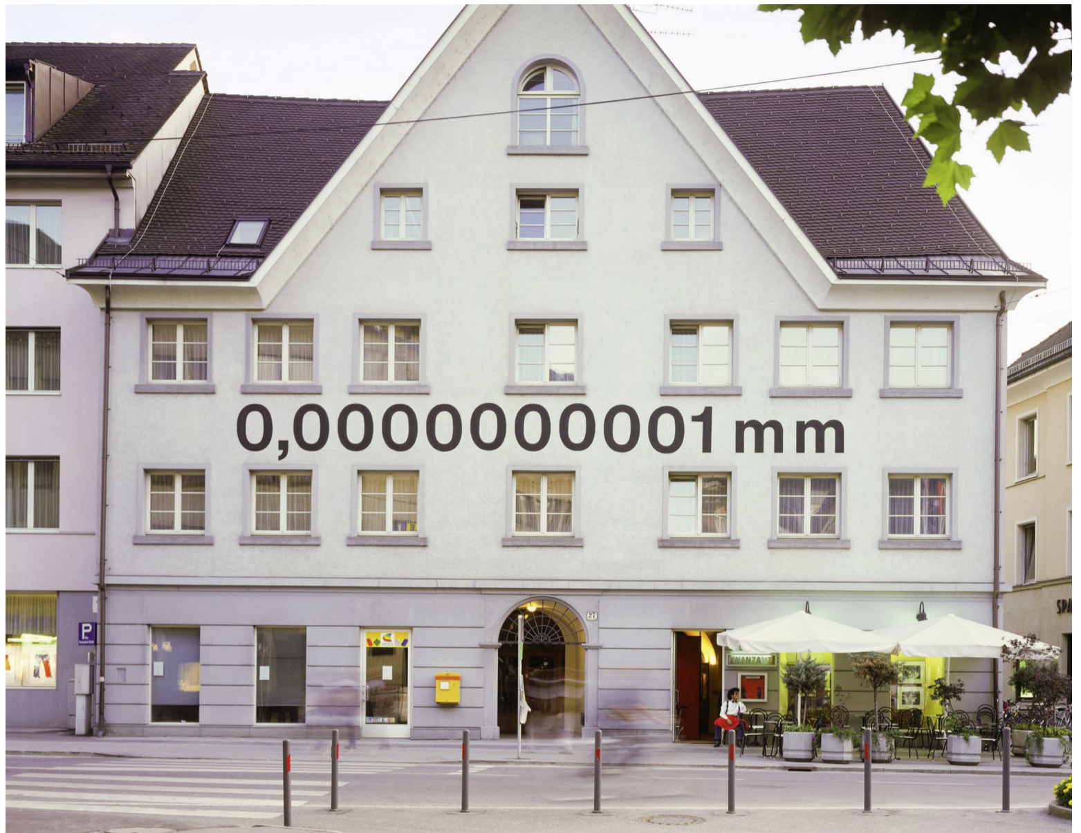
Seit 1997 schmückt Heinz Gappmayrs Ohne Titel die Rathausstraße 27 in Bregenz – eine Arbeit, die im Rahmen von Kunst in der Stadt entstand.

Der Gappmayr aber pickt (auch wenn aufgepinselt) nach wie vor – blieb auch nach dem Tod des Künstlers 2010. Sogar die Sommerreihe Kunst in der Stadt selbst, vier Ausgaben fanden bis 2000 statt, hat die Textinstallation am Kornmarkt überlebt. Mitunter auch, weil Gappmayr, das galt es zuletzt ja schon in Innsbruck zu beweisen, öffentlichen Raum kann . Weil in seiner Kunst die Betrachtenden und Vorbeilaufenden zum konstitutiven Teil des Werkes werden. Und letztlich im Nullkommanichts doch so viel vermittelt wird. Von Sprache, Text und Bild, vom Gedachten, Gegenständlichen und Sichtbaren.