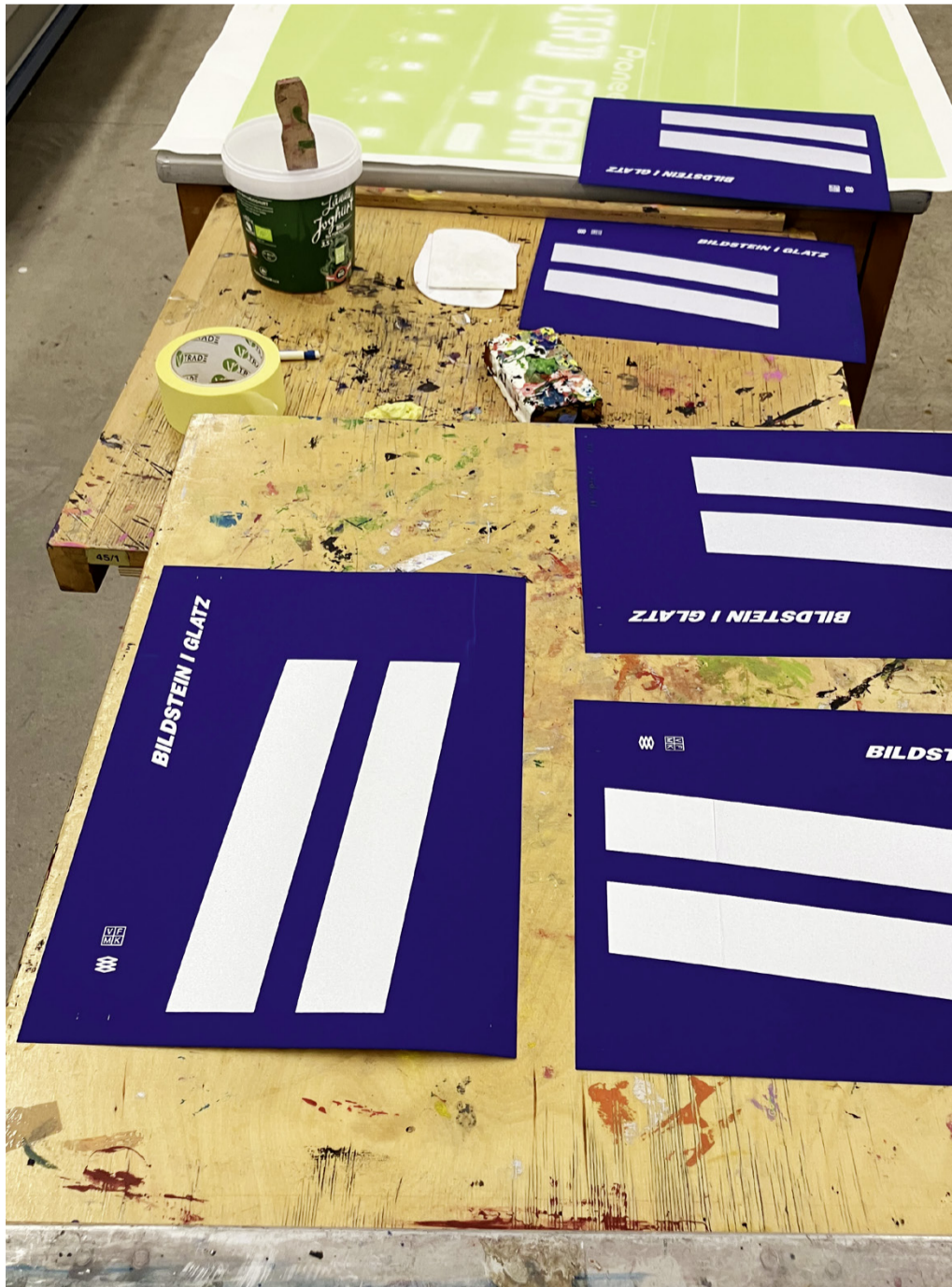
Feinabstimmung im Druckwerk Lustenau.