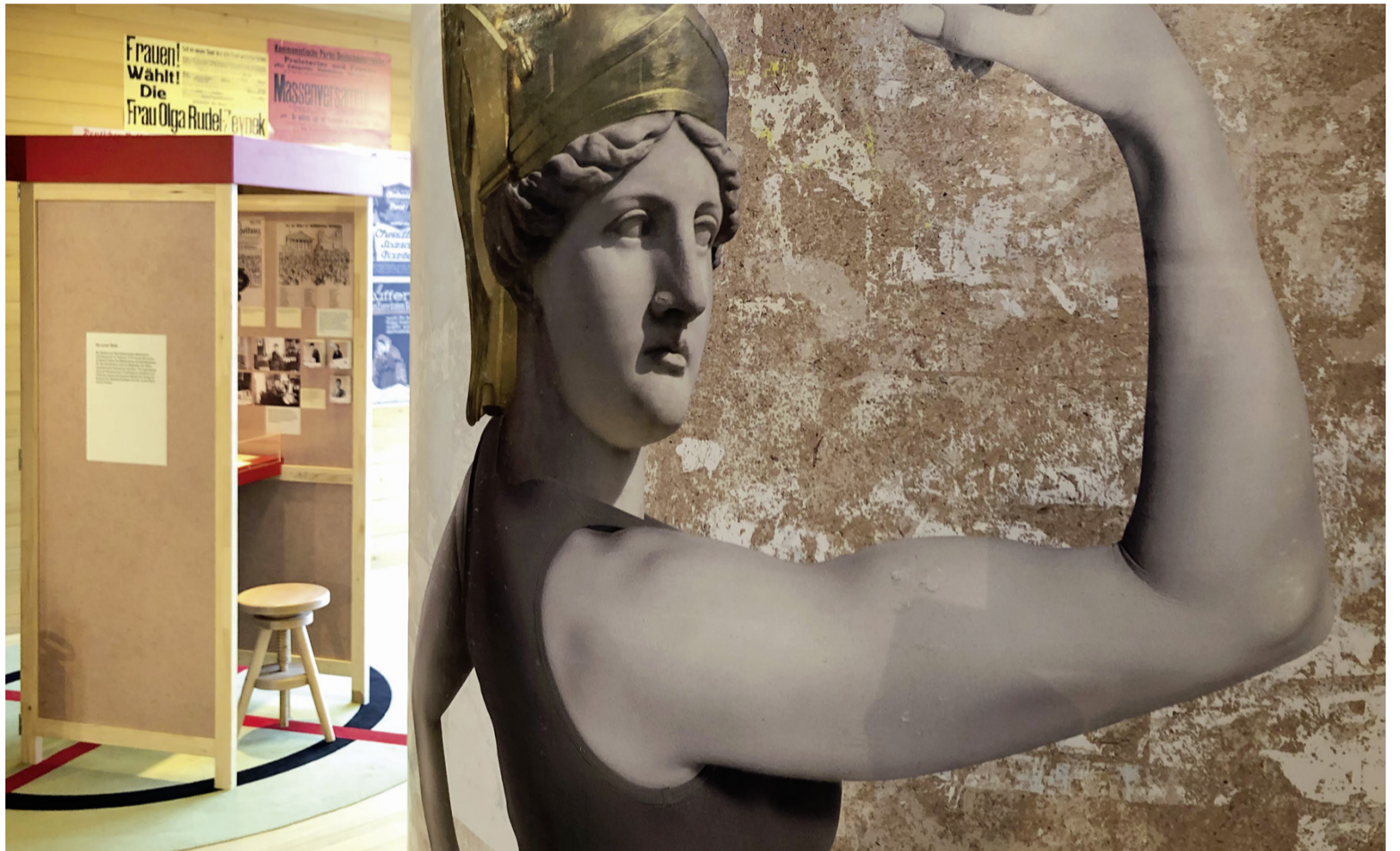
Ausstellungsansicht aus Sie meinen es politisch! 100 Jahre Frauenwahlrecht in Österreich.