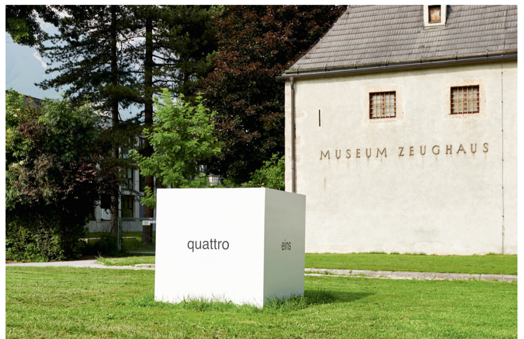
Bis Ende September zeigten die TLM an insgesamt zehn Stationen in der Stadt Innsbruck (hier am Museum im Zeughaus) Heinz Gappmayrs Textarbeiten.