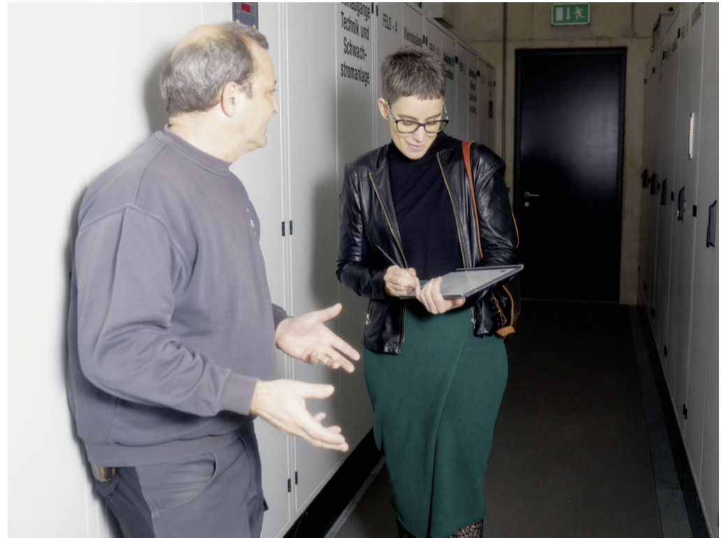
Das Technikteam des KUB arbeitet laufend an der Optimierung des Energieverbrauchs. Lokalaugenschein im Rahmen der Umweltzeichen-Zertifizierung.

N achhaltigkeit bleibt, allen Unkenrufen zum Trotz, zentrales Zukunftsthema unserer Gesellschaft – auch im Kulturbereich. Doch was bedeutet Nachhaltigkeit im musealen Kontext konkret? Welche Hürden gibt es? Und wie steht es um die Umsetzung in Vorarlberg?