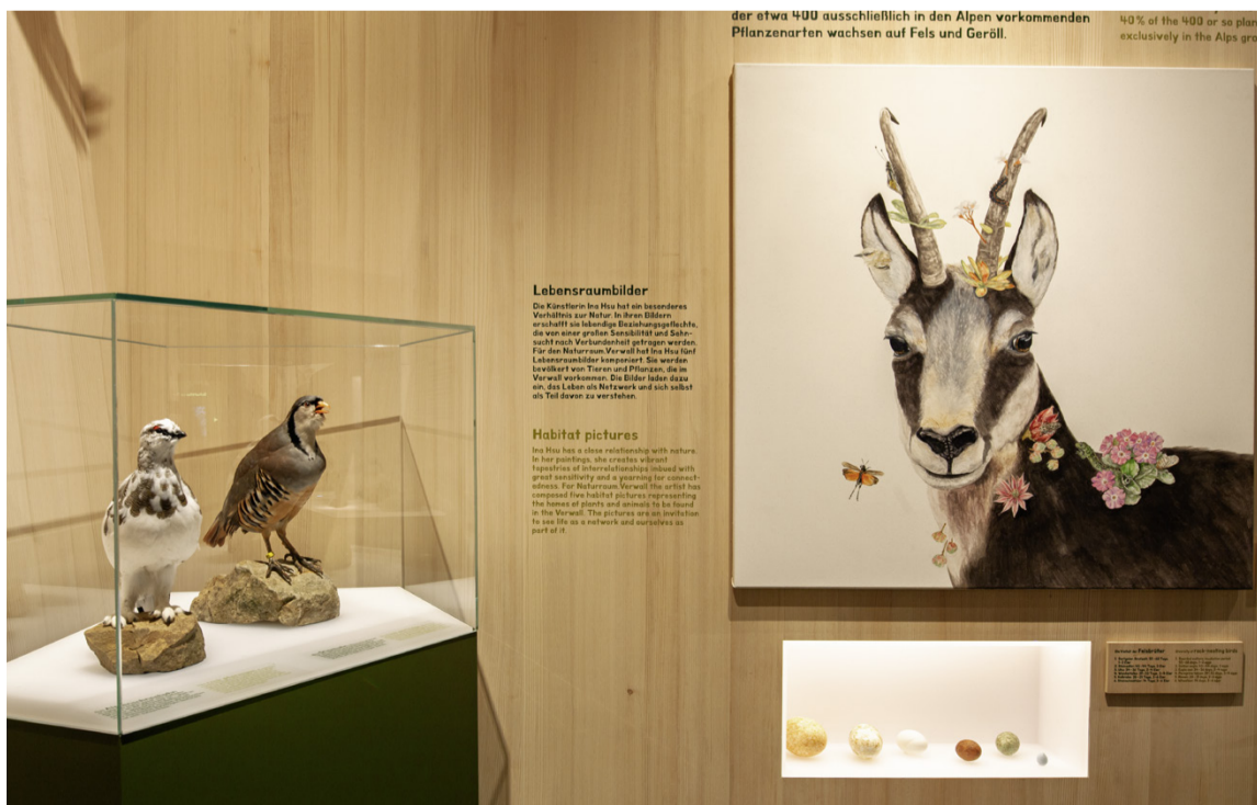
Zahlreiche Exponate und die Lebensraumbilder der Künstlerin Ina Hsu laden zum Entdecken ein.

Naturraum.Verwall Dorfplatz Partenen 6794 Partenen im Montafon https://naturvielfalt.at/naturraum-verwall