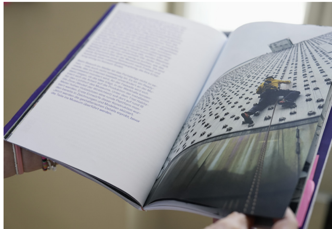
Work in progress: Dummy des Katalogs Bildstein | Glatz II.

Dann führt der eine Schritt zum nächsten und die Argumentationen für die gestalterischen Entscheidungen werden für alle Beteiligten nachvollziehbar und verständlich.“ Diese Entscheidungen führen dazu, dass die kleinen Details ein stimmiges Ganzes ergeben: Die Wahl der Typografie beispielsweise, die mit italic extreme und black extreme die Auseinandersetzung mit Extremen im Werk von Bildstein | Glatz widerspiegelt. Die Signature-Farben Ultramarinblau und Neonorange oder die Form des Buches, die mit einem Neigungswinkel von zwei Grad auf ihre Leitidee verweist: „Es beginnt alles mit einer Neigung, einer Biegung, einem Transformieren und Morphen von Geraden, Gegebenheiten, Normen und Erwartungen bis hin zur Entstehung von Dynamik, Bewegung – angedeutet, auffordernd, tatsächlich.“