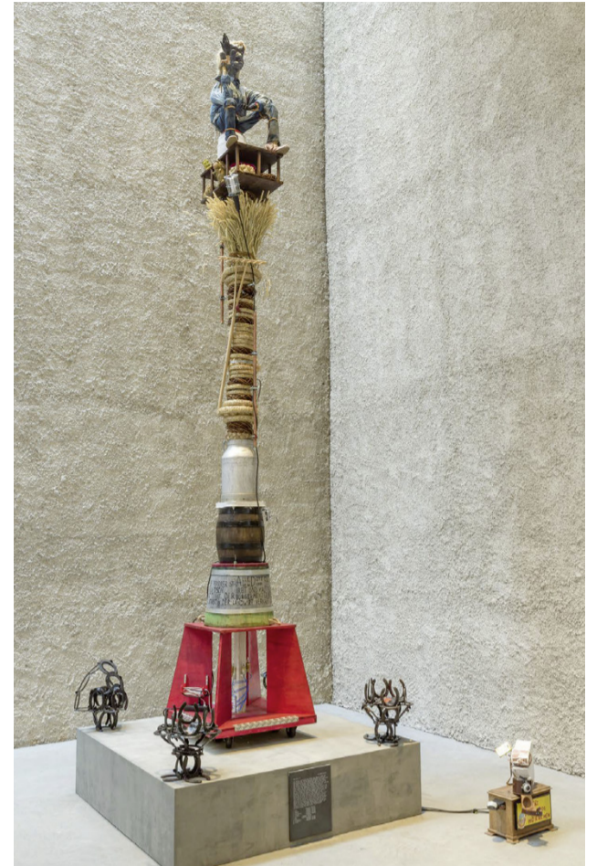
Marko Behankas Bauernsäule ist anlässlich 500 Jahre Bauernkrieg vom 22. November 2025 bis 22. Februar 2026 im Atrium des vorarlberg museums zu sehen.

Ein Schwerpunkt dieser Ausgabe widmet sich dem Gedenken an den Bauernkrieg von 1525. Im Atrium des vorarlberg museums wird dazu im November die Installation „1525 – Siegessäule für eine Niederlage“ eröffnet, ein Projekt, das wir in enger Kooperation mit dem Kunsthaus Bregenz realisieren. Parallel dazu blickt das Projekt COURAGE über Grenzen hinweg: Gemeinsam mit Partnern in Vorarlberg, Oberschwaben und dem Allgäu erinnert es an die damaligen Aufstände und fragt zugleich nach Zivilcourage und Demokratie heute.